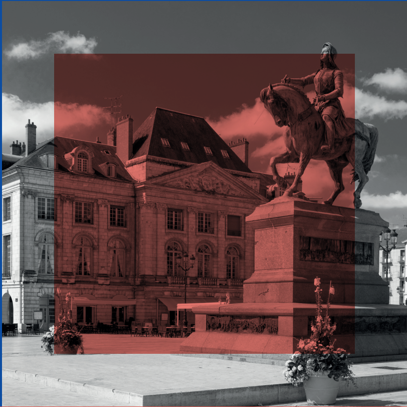
Photos : KOSMOS, Laurinda Hudgens, Seb Pouillard, Sébastien Tiphangne, Fotolia, iStock, Adobe Stock, Visiprof, Excelia, DR - 08/2024. Document non contractuel. La Direction se réserve le droit de modifier les enseignements, dates et tarifs des formations.