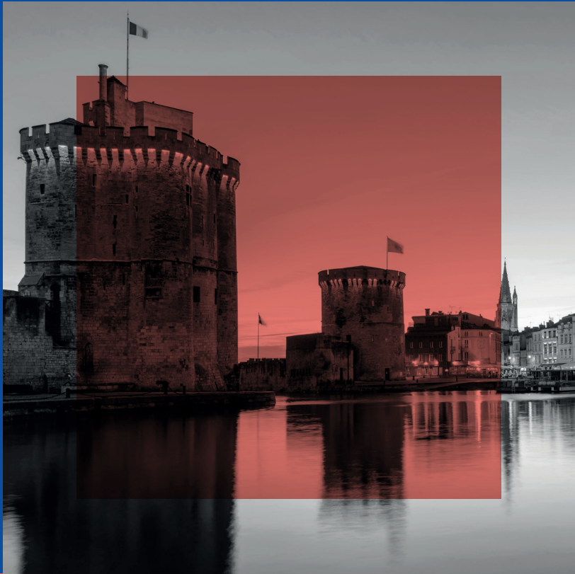
Photos : Laurinda Hudgens, KOSMOS, Camille Lambrecq, Seb Poullard, Mathieu Vouzeaud, Fotolia, iStock, Unsplash, Excelia_DR - 08/2024. Document non contractuel. La Direction se réserve le droit de modifier les enseignements, dates et tarifs des formations.